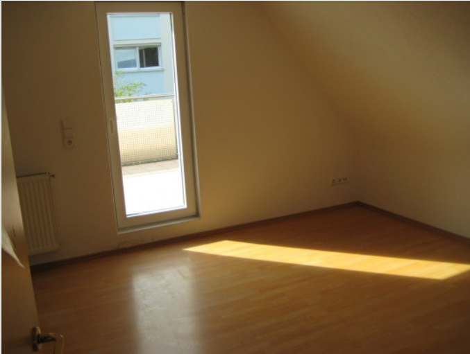
Zimmer OG mit Terrasse

Zimmer: 5,00 Wohnfläche ca.: 85,00 m 2 Kaufpreis: 380.000,00 EUR