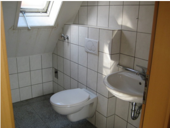
Bad mit Wanne + WC OG