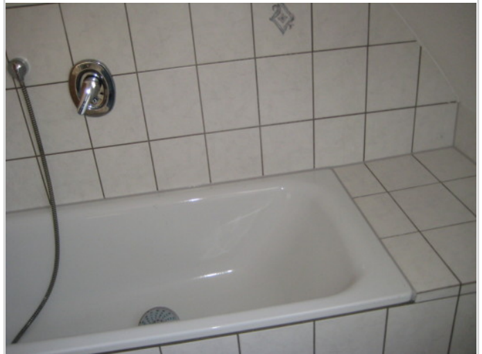
Bad mit Wanne OG.