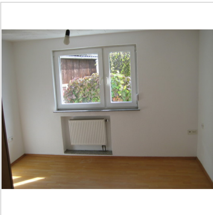
Zimmer EG .